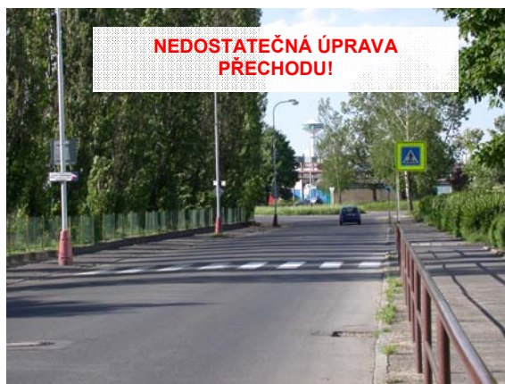
Obrázek 6: Příklad špatného řešení přechodu pro chodce (dlouhý přímý úsek řidiče svádí k vyšším rychlostem)