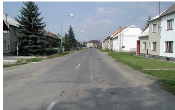
Obrázek 10: Jak průtah nemá vypadat (Rajhrad – před úpravou)