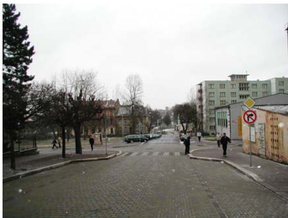
Obrázek 7: Příklad vysazené chodníkové plochy (Cheb)