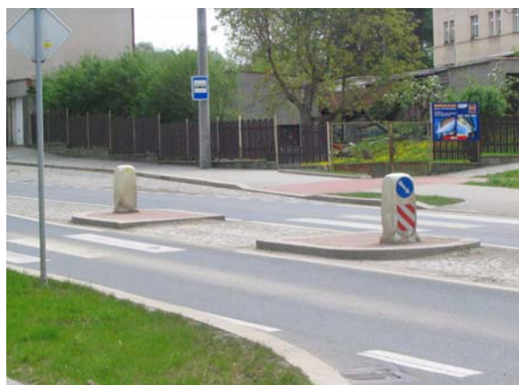
Obrázek 5: Příklad středního dělicího ostrůvku (Dobřany)