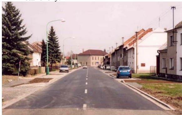
Obrázek 9: Příklad průtahu obcí (Rajhrad)