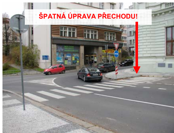
Obrázek 8: Naprosté nepochopení základního principu vysazené chodníkové plochy (Liberec)