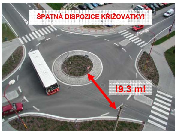
Obrázek 1: Příklad naddimenzované šířky okružního pásu, kdy šířka pojižděného prstence a šířka okružního pásu dávají dohromady zbytečně 9,3 m (Blansko).