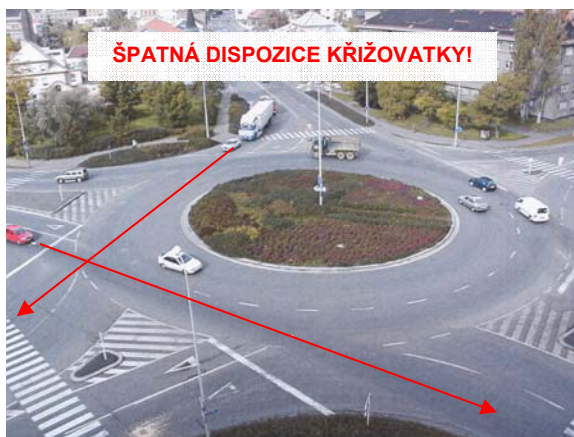
Obrázek 2: Při návrhu okružní křižovatky je nutné zabránit tangenciálním průjezdům (Kolín)