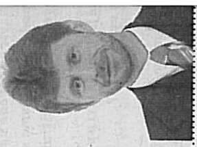
Miloš Vystrčil, hejtman

Na druhou stranu víme, že se v dohledné době nepodaří opravit všech- ny krajské silnice. Zde- děný vnitřní dluh je ve výši cca 40 mld. korun a několikrát násobně přesa- huje možnosti krajské- ho rozpočtu. Situace ře- šíme vydefinováním tzv. páteřní silniční sítě.