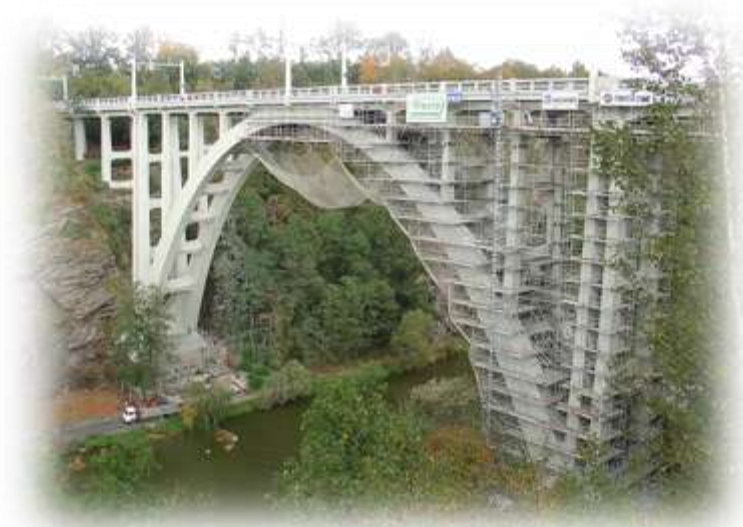
Rekonstrukce mostu v Bechyni