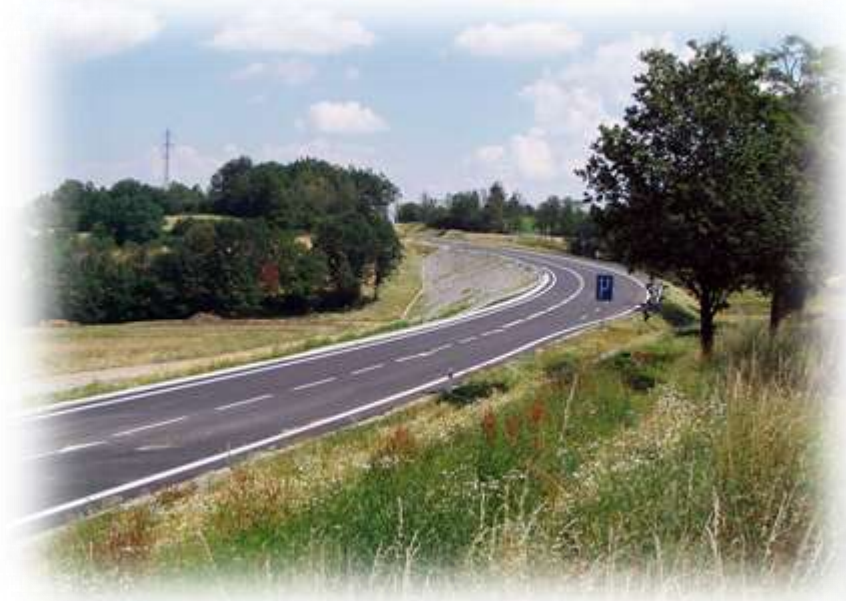
Přeložka silnice II/145 Husinec - Běleč