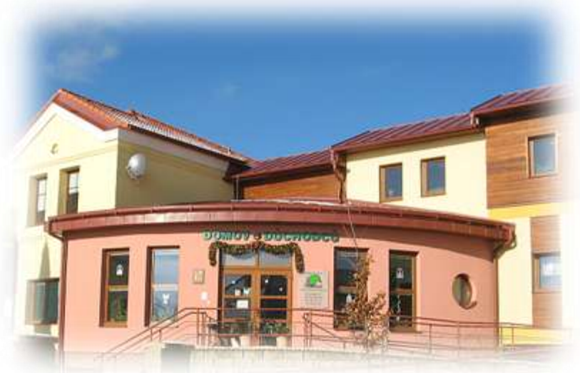
Domov důchodců Horní Planá