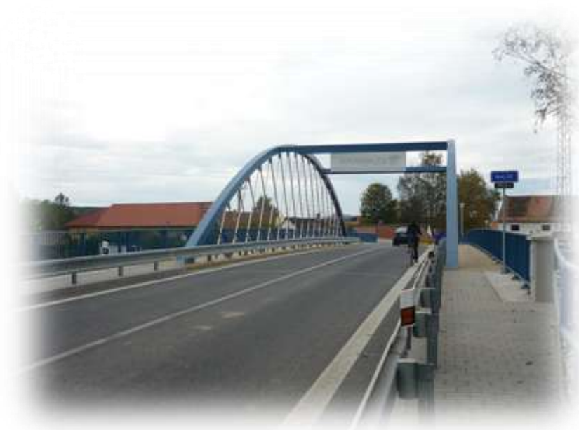
Most ev. č. 15 532 – 1 Roudné