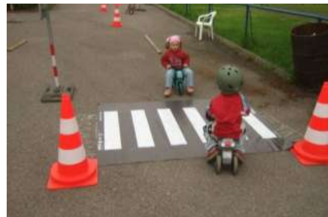
Kostelec nad Orlicí