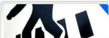
Rady pro chodce