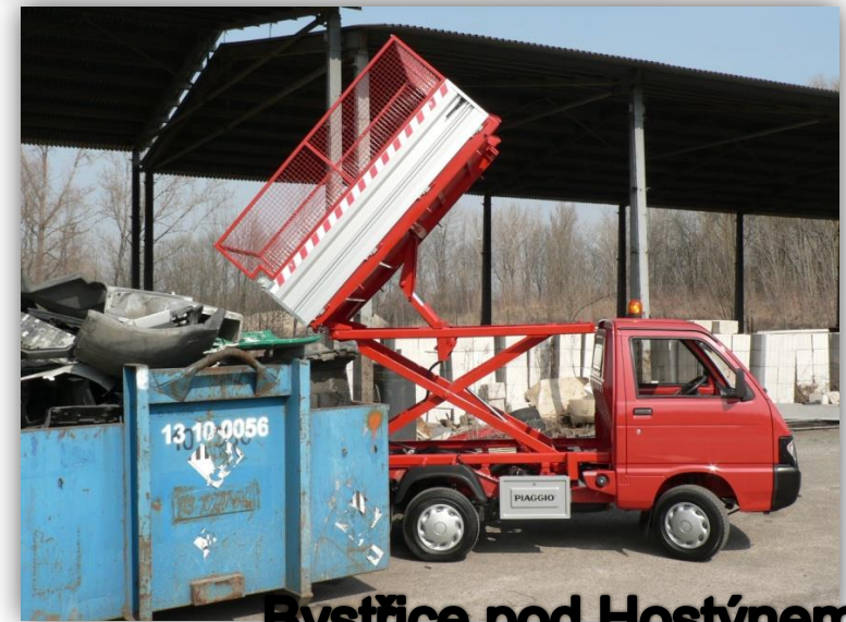
Bystřice pod Hostýnem